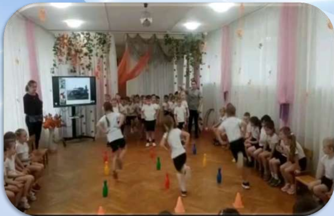
Физкультурно- оздоровительный праздник «Мы - Тулячки»

Проведение мероприятий, посвященных празднованию важных дат нашего родного города