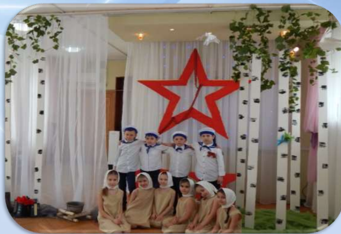
Тематический праздник для детей старшего дошкольного возраста «Тулу врагу не отдадим»