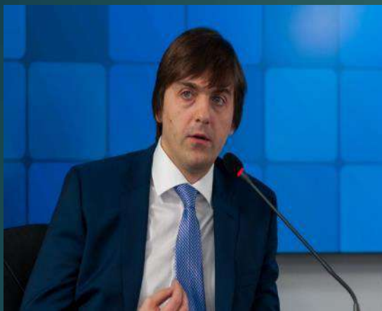
С.С. Кравцов - министр просвещения РФ

Система школьных театров и детских театральных конкурсов развивается по поручению Президента РФ и является важным инструментом воспитания подрастающего поколения и социальным лифтом для талантливых детей.