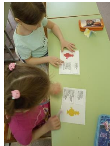
Виртуальная экскурсия в Тульский музей самоваров Альбом загадок, пословиц о самоваре