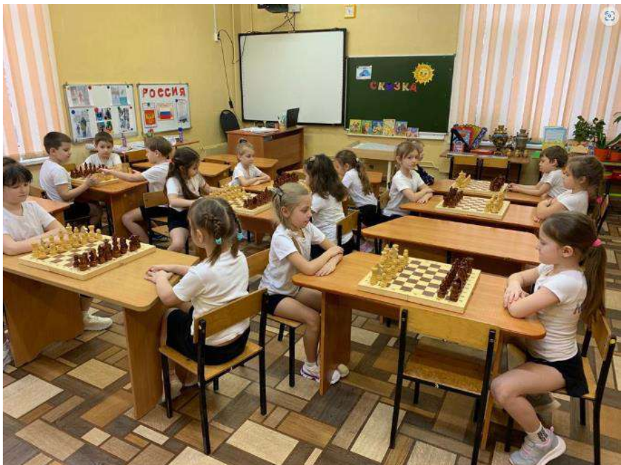
Игра в парах на шахматных досках