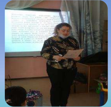
Работа с педагогами и выступление на педагогических советах