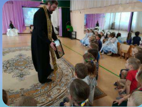
Цикл занятий по изучению основ православной культуры