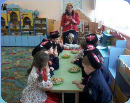
Проведение не традиционных занятий с детьми