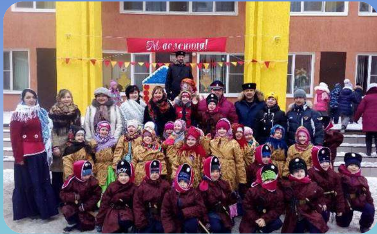
Проведение итогового мероприятия «Масленица» с детьми и родителями