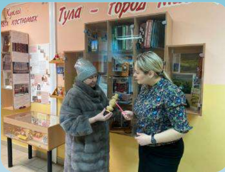
Беседы и консультации с родителями