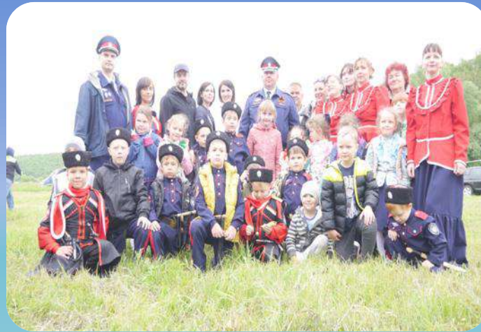
Совместные экскурсии с детьми и родителями в исторические места нашего города