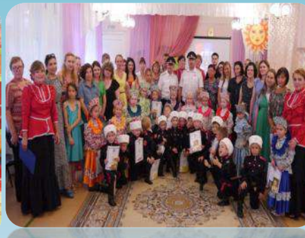
Привлечение родителей к открытым мероприятиям