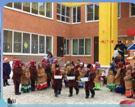
Привлечение родителей к открытым мероприятиям