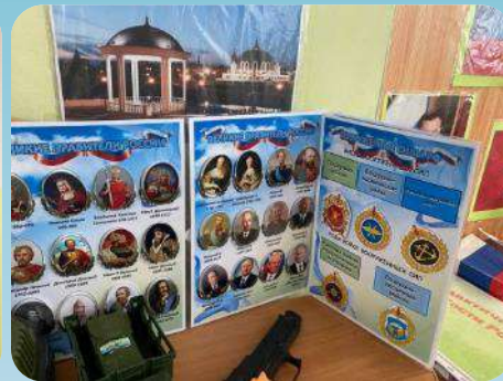
Помощь родителей в организации РППС