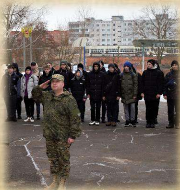
«Безопасность военной службы»

Предусматривает проведение занятий по дисциплинам: