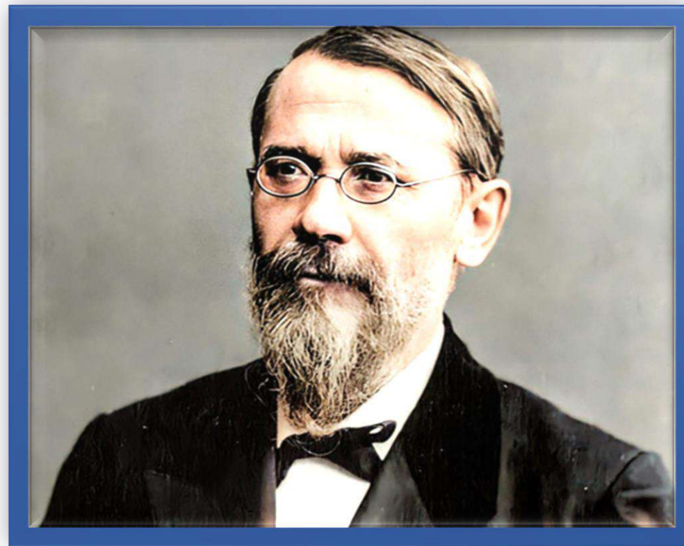
Васи́лий О́сипович Ключе́вский

«Музыка — это лекарство, которое помогает преодолеть депрессию, мрачные стороны жизни, проблемы и неудачи. А потом — дарит желание жить дальше».