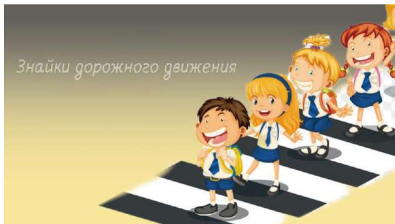
«Знайки дорожного движения»