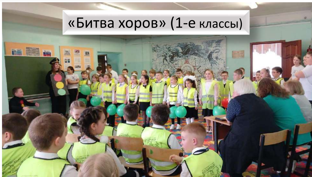
«Битва хоров» (1-е классы)