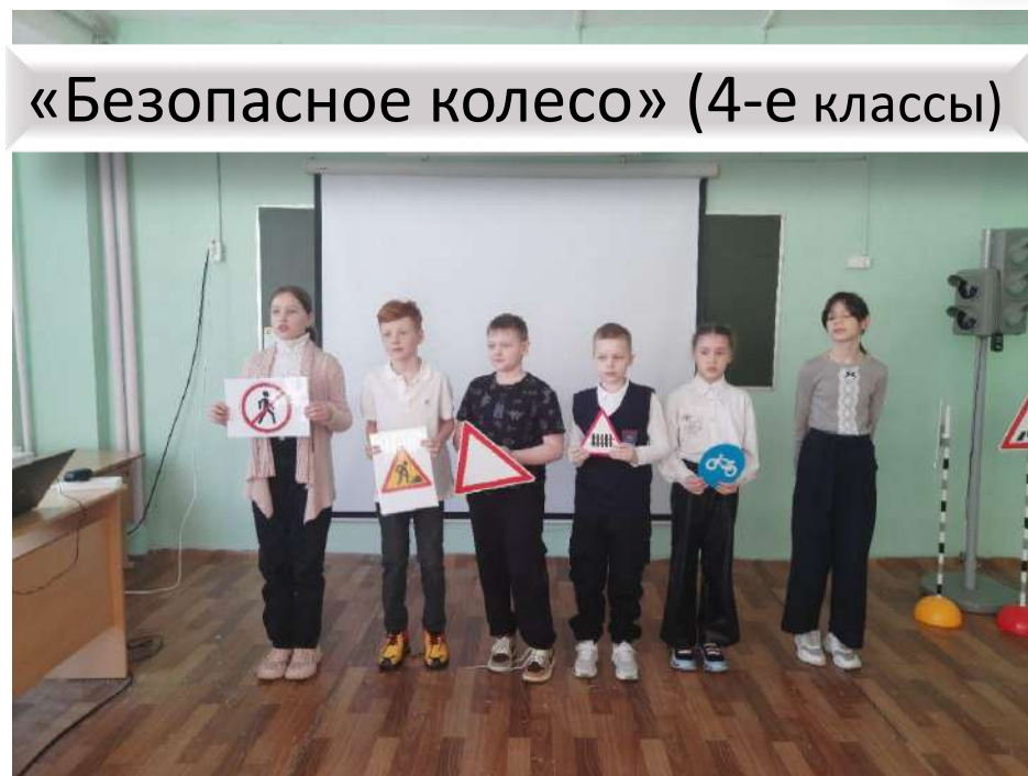
«Безопасное колесо» (4-е классы)