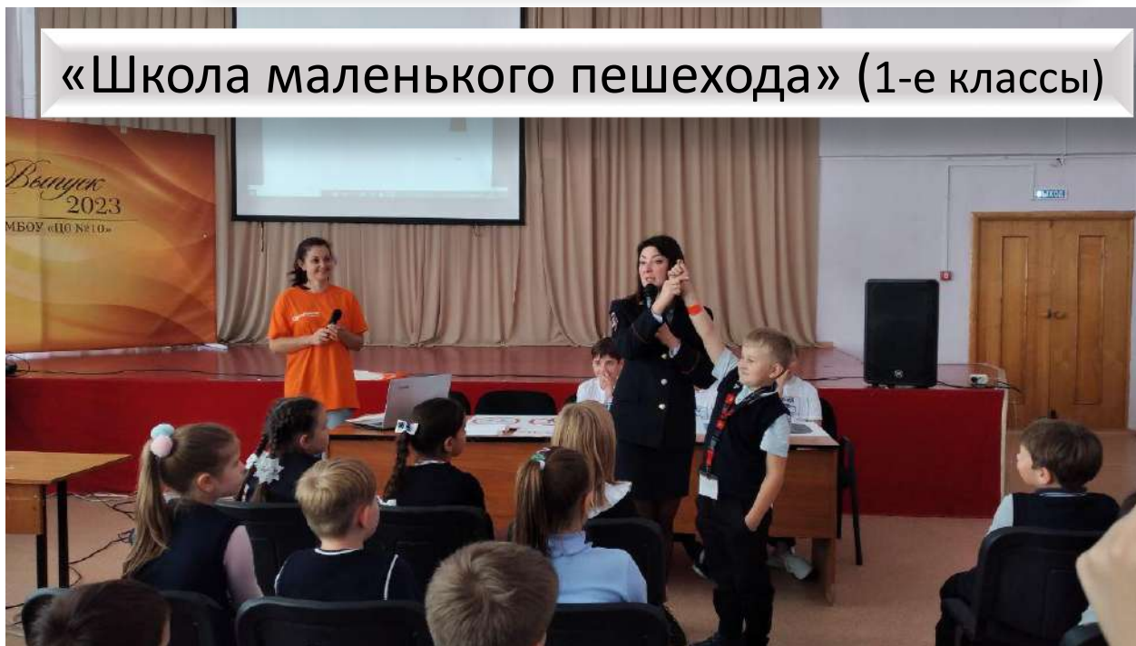
«Школа маленького пешехода» (1-е классы)