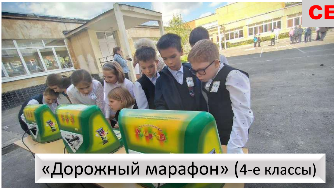
«Дорожный марафон» (4-е классы)