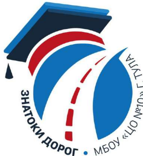
Отряд юных инспекторов движения «Знатоки дорог»