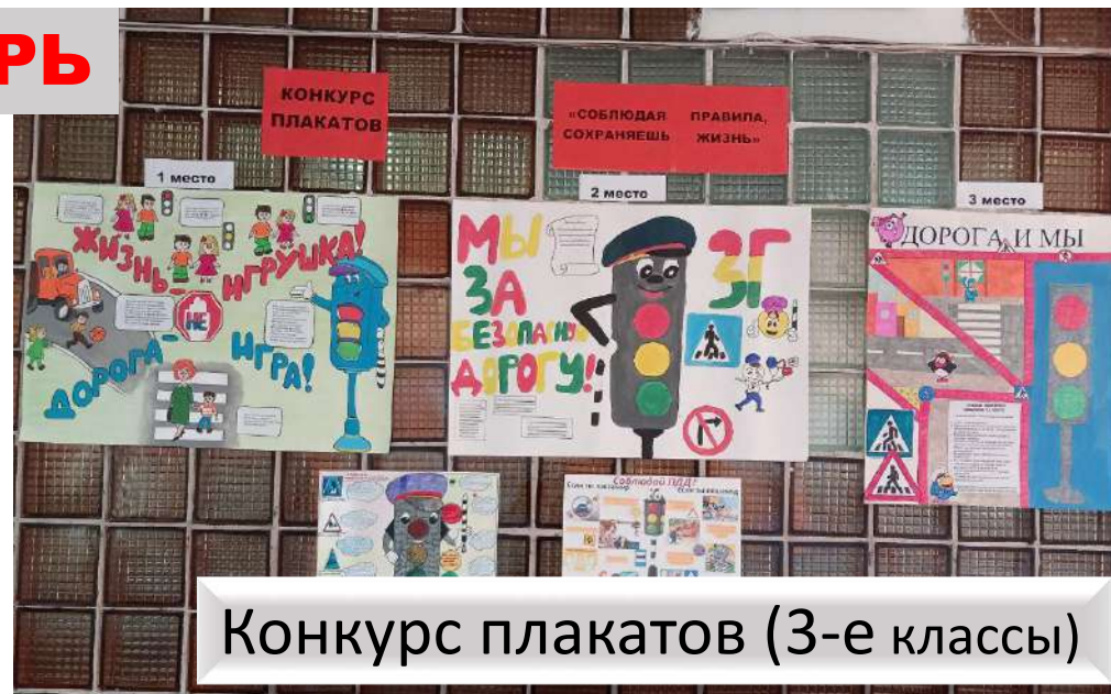
Конкурс плакатов (3-е классы)