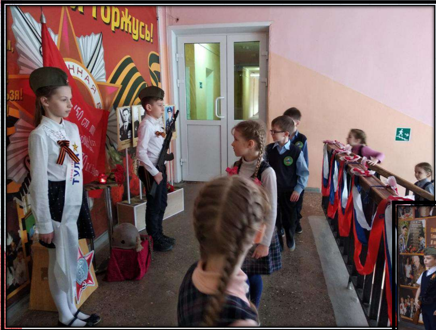
Почетная вахта у знамени Победы – учащиеся 4-х классов