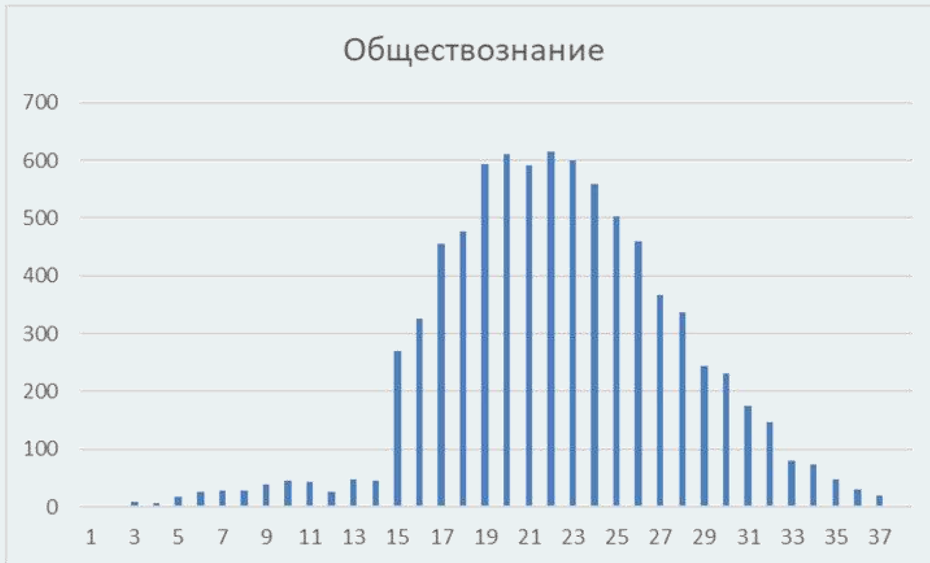
Диаграмма распределения тестовых баллов участников ОГЭ по обществознанию в 2024 г.