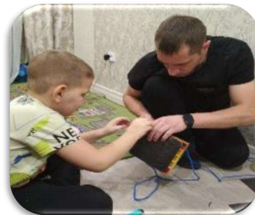
Семейная акция «Помоги зимующим»