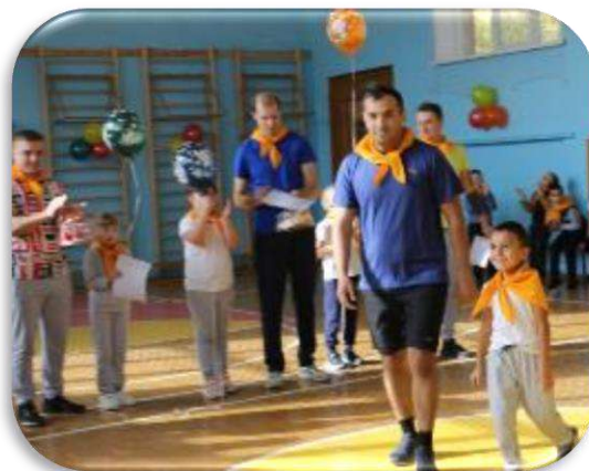
Спортивный праздник «Мой папа самый лучший»