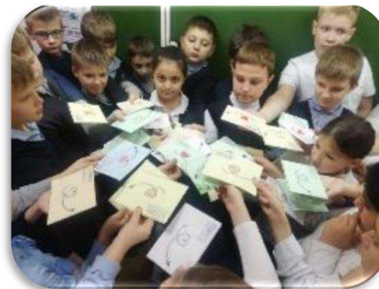
Семейная акция «Письмо солдату»