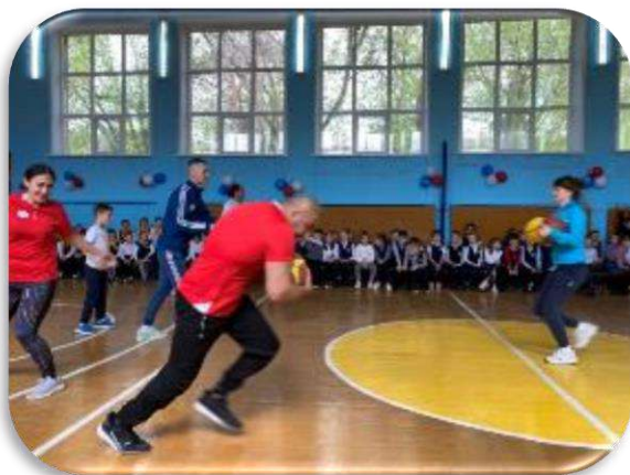
Семейный спортивный праздник