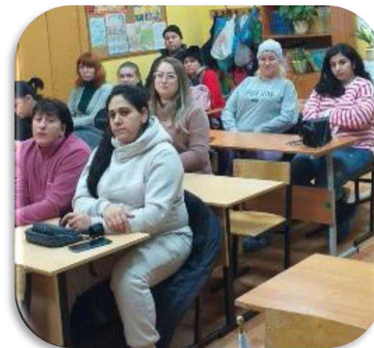
Родительское собрание «Взаимодействие семьи и школы»