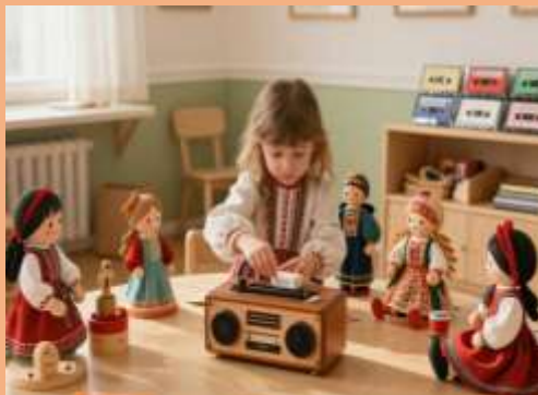
Сюжетно-ролевые игры с аудиосказками и театральная деятельность