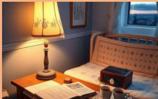
Ритуалы перед сном и семейное прослушивание